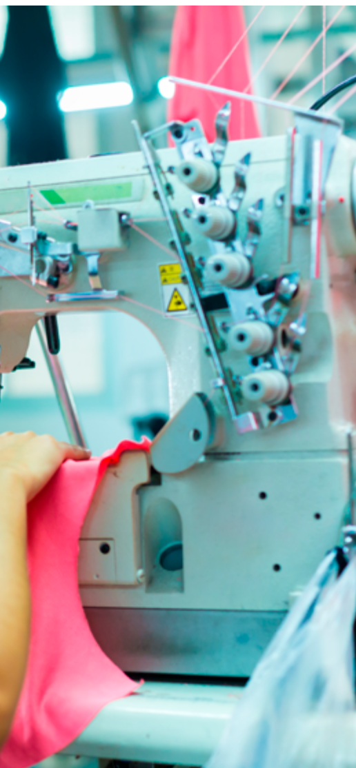
IMPORTACIONES TOTALES DE PRENDAS DE VESTIR DE EE.UU. periodo ene - may 2019 - 2020.

El Instituto de Investigación y Desarrollo de Comercio Exterior (Idexcam) de la Cámara de Comercio de Lima (CCL) señala que dentro de los productos que Estados Unidos ha disminuido en sus importaciones desde China se encuentran las confecciones textiles. Asimismo según la base de datos de OTEXA ( The Office of Textiles and Apparel ) hasta al mes de mayo las importaciones totales de confecciones de los Estados Unidos disminuyeron en 28%. Las confecciones chinas son las más golpeadas con esta situación (-49%), le siguen las provenientes de Vietnam (-9%), Bangladesh (-12%) e Indonesia (-15%).